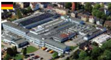
Casa madre Velbert, Germania