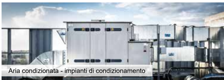
Aria condizionata - impianti di condizionamento