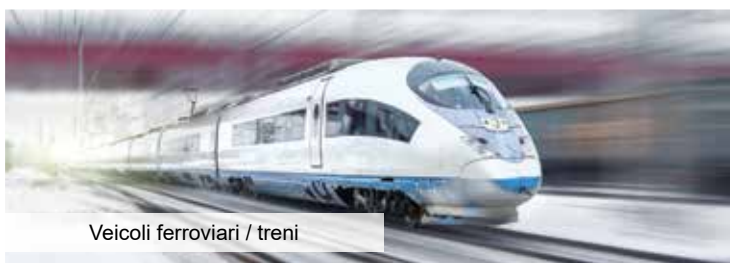
Veicoli ferroviari / treni