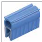
Guarnizioni di tenuta e profili per spigoli