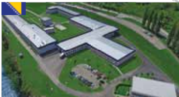
Stabilimento 1 di Goražde, Bosnia-Erzegovina