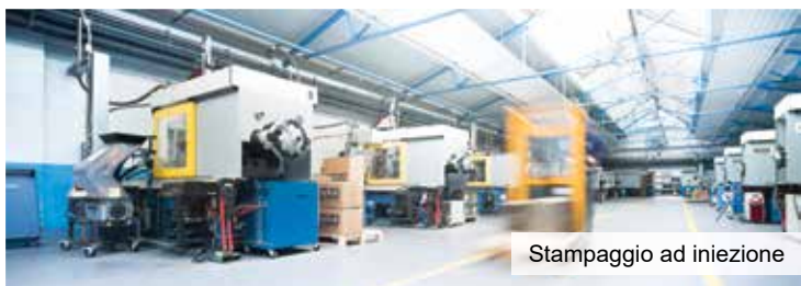
Stampaggio ad iniezione