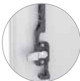
Serratura per aste con linguetta