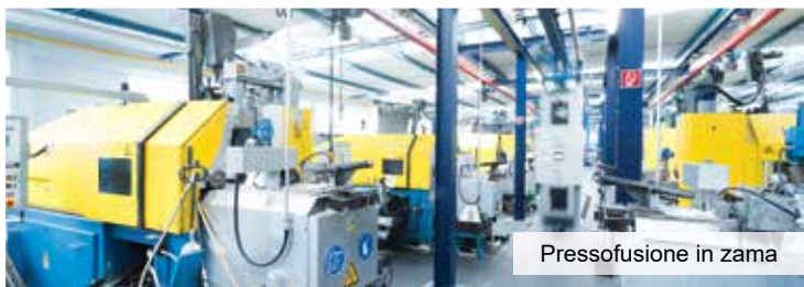
Pressofusione in zama