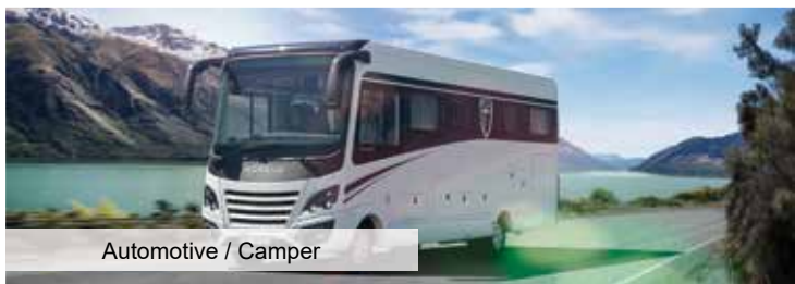
Automotive / Camper