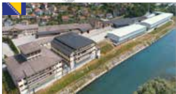
Stabilimento 2 di Goražde, Bosnia-Erzegovina