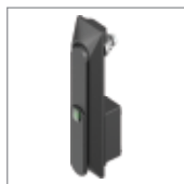
Sistemi di chiusura