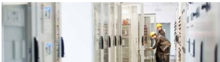
Quadri elettrici e di comando / armadi serve / telecomunicazione

EMKA è leader in tutti i reparti, grazie all'alto grado di integrazione verticale dell'intero processo produttivo - dall'idea al prodotto finito.