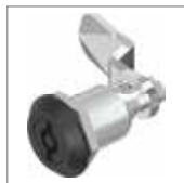
Chiusure 1/4 di giro