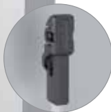
Terminale con rotella