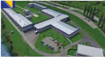
Goražde (site 1), Bosnie Herzégovine