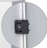
Guide de tringle