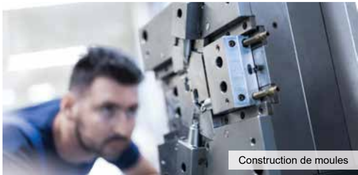
Construction de moules