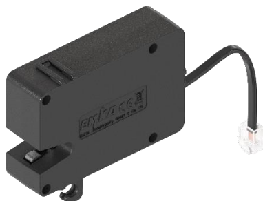
Fig. 1: 3000-U330-xx