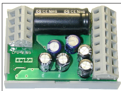
Fig. 1: 3000-U07